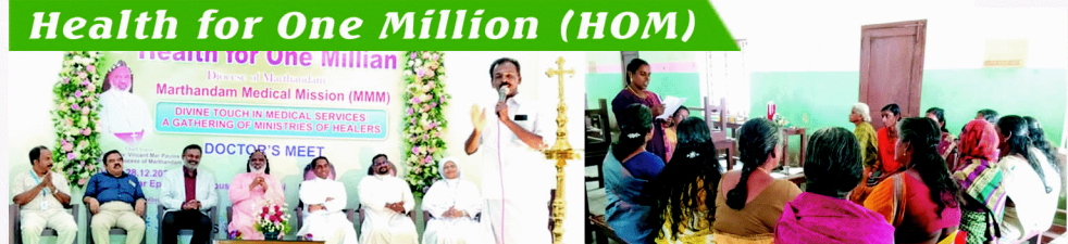
Health for One Million (HOM)