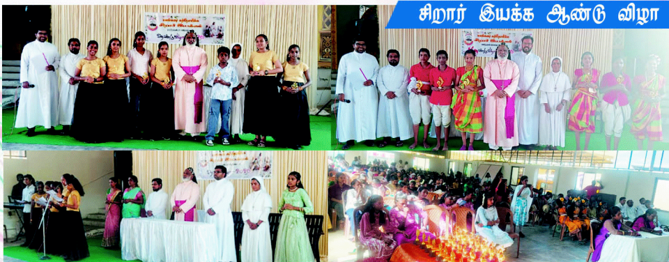
சிறார் இயக்க ஆண்டு விழா