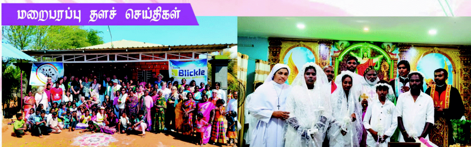
மறைபரப்பு தளச் செய்திகள்