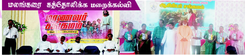
மலங்கரை கத்தோலிக்க மறைக்கல்வி