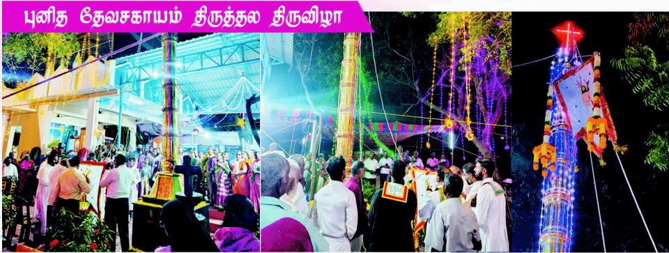
புனித தேவசகாயம் திருத்தல திருவிழா